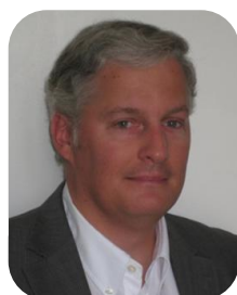
Stéphane de MIOLLIS