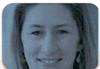
Lucile CASTEX- CHAUVE DG TRAVAIL