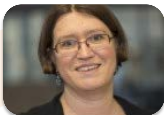
Céline LOUBETTE AFP