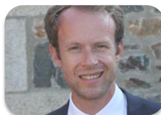
Vincent FILHOL PARQUET NATIONAL FINANCIER